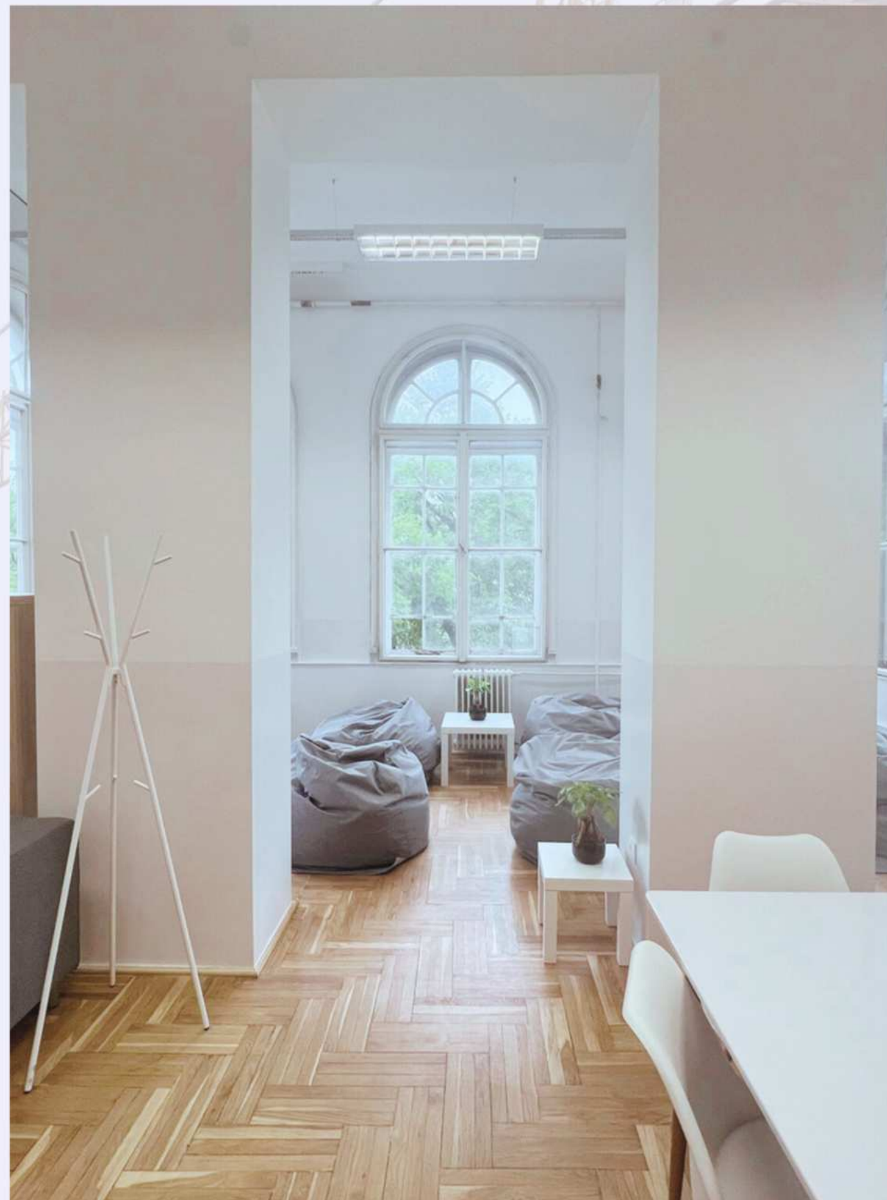
Képek: A 2024-es YBL Szakmai Nap kitelepülési díjaiból létrehozott közösségi tér az YBL-ben.